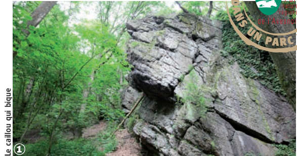
Le caillou qui bique