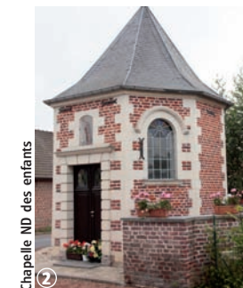
Chapelle ND des enfants